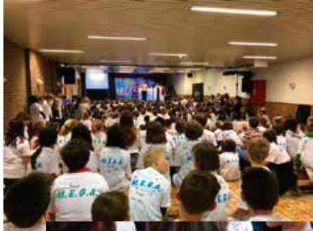
MEGA fuif 09/05/2019 463 leerlingen, 15 medewerkers en 20 leerkrachten waren aanwezig.