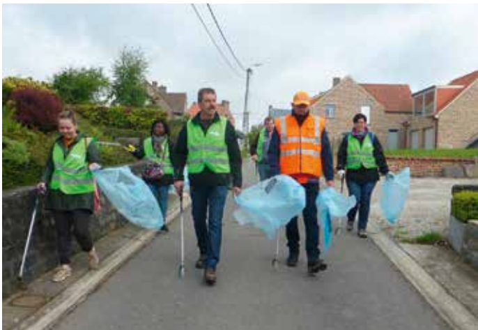
Zwerfvuilactie 10/05/2019 Het voltallig gemeentepersoneel van Galmaarden trok op vrijdag 10 mei de straat op om het zwerfvuil langs de straten op te ruimen