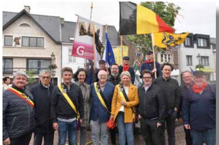
Meiboomplanting 07/06/2019 Eerste Meiboomplanting in Galmaarden. De 'Meiboom' werd geplant op het Marktplein van Galmaarden.